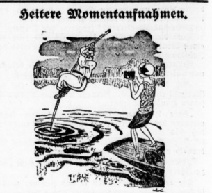
Das' ist, Papa, und lächle ein bißchen — es wird ein großartiges Bild!

Was ist das, konnte diesem Wunsch nicht entsprechen werden. „So eine Driftschiff! Jetzt werden wir bei Nacht und Nebel auf freiem Felde abgesetzt und dürfen noch froh sein, wenn wir überhaupt mit selten Knochen unten ankommen.“ Das Motorgeräusch war verhallt; langsam lenkte sich der lagungswortende Vogel und landete endlich auf einer Höhe, auf der keine Nebelschichten in sanfterm Wohllicht wogen. Tränfel war bis zur Bankstraße und lassen wir uns von Frankfurt ein Auto kommen. Der Funker kann unter Position nach Berlin melden und das Auto einfahren.“ (Fortsetzung folgt.)