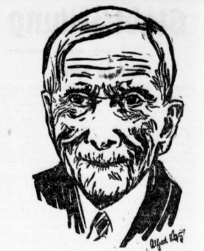
JOHN D. ROCKEFELLER