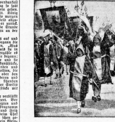
Die Münchner Rind'n im Festzelt. Das Oktoberfest, das große bayerische Volksfest ...