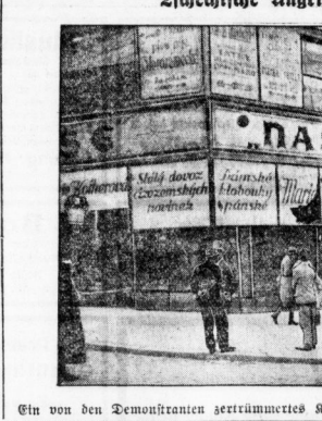
Ein von den Demonstranten getrimmtes Kind, in dem der deutsche Film 'Der Wasserträger' lief.