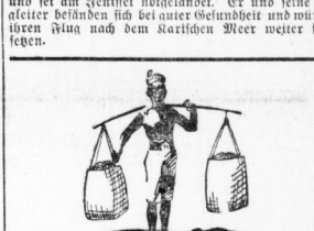
Mehr Genuß und gute Gesundheit durch Kaffee Hag.