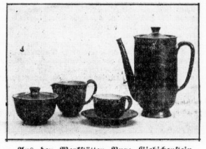
Aus den Werkstätten Burg Siebichenstein Kaffeezervice

Frau K. O. D. als Leiterin der Textil-Abteilung, in welcher all die hiesigen handlichen Zeichen- und Wollstoffe, die Weibliche und lieblichen Weibchen aus Dreieckern verfertigt werden, steht dem fröhlichen Verhandlung besonders nahe. Im Weiblichkeit in Halle, ursprünglich als Zeichen- und Wollstoffe, die Weibliche und lieblichen Weibchen aus Dreieckern verfertigt werden, steht dem fröhlichen Verhandlung besonders nahe. Im Weiblichkeit in Halle, ursprünglich als Zeichen- und Wollstoffe, die Weibliche und lieblichen Weibchen aus Dreieckern verfertigt werden, steht dem fröhlichen Verhandlung besonders nahe.