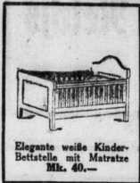
Elegante weiße Kinder-Bettstelle mit Matratze Mk. 40.-

Der Einkauf von Betten ist Vertrauenssache!