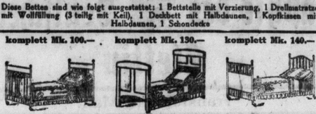
Bettstellen für Erwachsene und Kinder in hundertfacher Auswahl: Mk. 16.- 18.- 21.- 26.- 32.- 38.- 44.- 47.- 52.- usw. Prachtvoll füllende weiße Federn, Halbdauen und Daunen: Pfund Mk. 4.25 4.75 5.50 11.- 12.- usw.