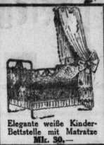
Elegante weiße Kinder-Bettstelle mit Matratze Mk. 30.-

Steppdecken Daunendecken in schönsten Farbbelegungen Reform-Unterbetten Robhaar-Kopfkissen Chaiselongues Bett-Chaiselongues