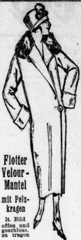
Plotter Velour-Mantel mit Pelzkragen. It. Bild offen und geschlossen zu tragen.