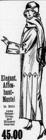
Elegant. Affen-haut-Mantel. It. Bild ohne Schalform, mit Biberbesatz.