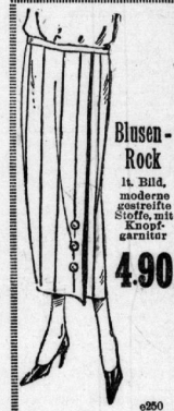
Blusen-Rock. It. Bild, moderne gestreifte Stoffe, mit Knopf-garnitur. Stück 4.90