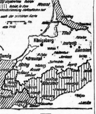
Die Abstimmung im Ost- und Westpreußen.

die Hauptrolle bei den Verhandlungen spielen sollen. Die Verhandlungen sind zum Stillstand gekommen. Die Verhandlungen sind zum Stillstand gekommen.