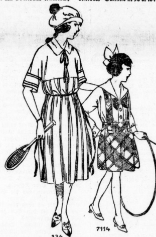
336. Sport- o. Schulkleid a. gelbrottem u. glattem Stoff. Schmalen Gombandgürtel mit herabhängenden Enden zu beiden Seiten. Schmitze in 86 u. 90 cm Oberweite erhältlich. 7114. Trillerröckchen aus karierterem Stoff. Blüze aus reinem Stoff für kleine Mädchen. Schmitze für das Alter von 6—14 Jahren.