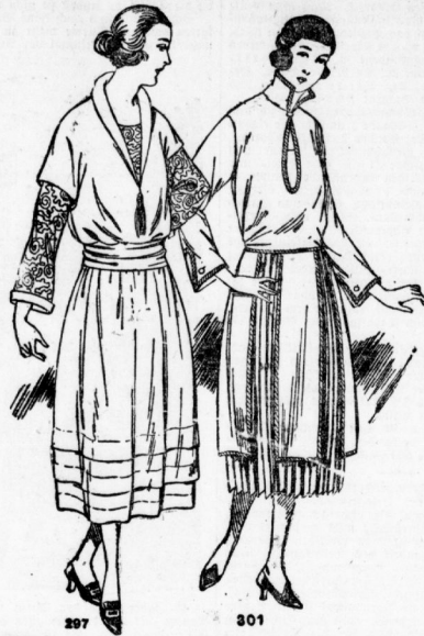
297. Kleid aus lederbrauner Gaborine, mit Ärmeln und Einfach a. gemusterter Seide. Schmitze in 96 u. 104 cm Oberweite erhältlich. 301. Kleid a. dunkelblauem Stoff m. schwarzer Treffeherabrandung u. plissiertem schwarzen Seidenrock. Zum Aufarbeiten eines älteren Kleides. Schmitze in 96 u. 104 cm Oberweite.

Zimmerhin wirkt solch ein zusammengesetztes Kleid trotz der einfachen Machart viel eleganter, wie dies einem einfARBigen Kleide möglich wäre. Ebenso verhält es sich mit dem Kleide Abb. 297. Die ärmellose