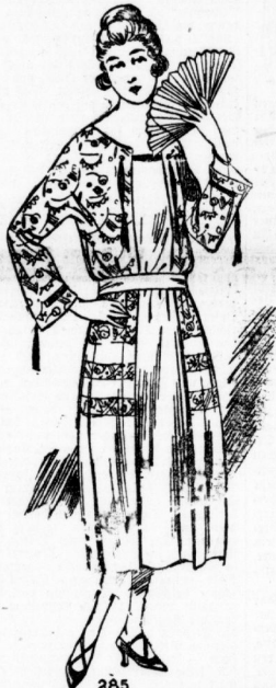
285. Kleid aus G. u. u. Tuch mit Taillenteil und Rockblenden aus Wiener Bärklätten-Seide. Die Schmitze sind in 96 und 104 cm Oberweite vorrätig.