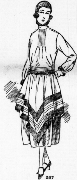
287. Elegantes Kleid mit Zipfel-Tunika. Befestigung mit breiter Treffe und Goutache. Unterkleid aus schwarzer Seide. Schmitze in 90 und 96 cm Oberweite.

Vorstehende Abbildungen sind den Modealben „Die Neueste Deutsche Mode“ entnommen. Zu allen darin angeführten Modellen sind tadellos sitzende Schnittmuster mit guter Arbeitsanleitung vorhanden. Modealben u. Schnittmuster vorrätig bei A. Huth & Co.