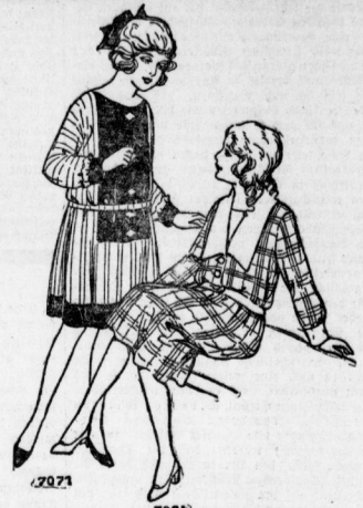
7071. Wollkleid aus gestreiftem Stoff, Sahel und Randblende aus Samt oder dunklem Tuch. Schnitt für das Alter von 4-6 und 6-8 Jahre vorrätig. 7084. Mädchenkleid aus kariertem Stoff mit Ärgern und Guffchigen aus einfarbigem Stoff. Schnitt für 8-10, 10-12 und 12-14 Jahre vorrätig.