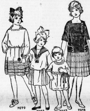
7079. Mädchenkleid aus glattem u. gestreiftem Stoff. Zur Verwendung von zwei Kellern geeignet. Schnitt für 8-10, 10-12 und 12-14 Jahre vorrätig. 7083. Matrosenkleid, Kleiderform mit Schlußbluse. Schnitt für 6-8, 8-10 12-14 Jahre stets vorrätig. 7257. Dunkelblaues Wollkleid mit grün-gelber Kähnel und Zierfächerzierung. Kurzes Ärmchenkleid, gerades, angelegtes Röckchen. Schnitt für 1-2, 2-4 und 4-6 Jahre vorrätig. 7078. Kleidsamer Mädchenanzug Bluse aus schwarzem Samt oder dunklem Stoff, Röckchen aus plüschigem, kariertem Stoff. Schnitt für 8-10, 10-12 und 12-14 Jahre.

Jahrgänge natürlich gern in weiß kleiden, aber auch ein dunkles Kleidchen wirkt allerlieblich, wenn es hübsch gemacht und irgendwie farbig aufgeputzt ist, sei es durch einfache Handnäherlei oder durch eine flotte wirkungsvolle Stickerei in Wolle oder Garn.