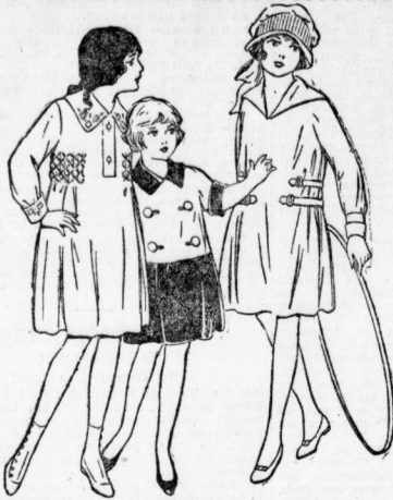
7081. Kleid aus leichtem Stoff mit Wollmähner und vorderem Schluß. Schnitt für 4-6 und 6-8 Jahre vorrätig. 7136. Kleid aus hellem u. dunklerem Stoff. Zur Verwendung von zwei Stoffarten geeignet. Die Schnitt für 4-6 und 6-8 Jahre vorrätig. 7112. Kleid mit schmalem Doppelgürtel. Schnitt für 6-8, 8-10 und 10-12 Jahre stets vorrätig.

Wer es sich leisten kann wird die jüngsten