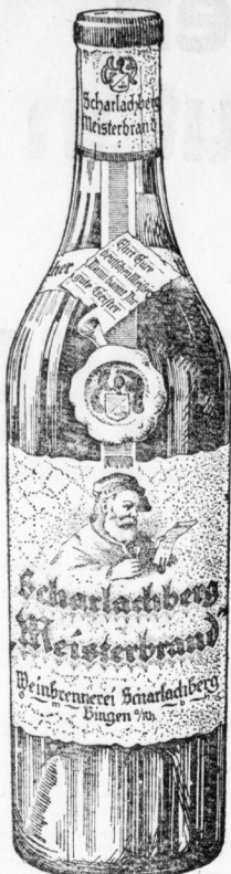
Als Qualitätsmarken außerdem beliebt: Weinbrand Scharlachberg Gold Weinbrand Scharlachberg Auslese