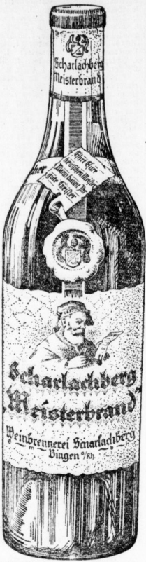
Als Qualitätsmerkmale außerdem beliebt: Weinbrand Scharlachberg Gold Weinbrand Scharlachberg Auslese