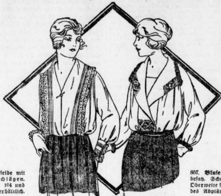
855. Bluse aus Weißseide mit breiten Trauer-Katzenlägen. Schlitze hierzu in 104 und 112 cm Oberweite erhältlich.