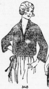
348. Bluse aus Seidenstoff mit Handtasche von geschmiedetem Stahl. Von unseren Handtaschen. Schlitze: 88 und 90 cm Oberweite.