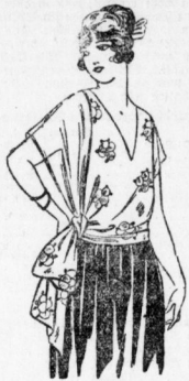
871. Theater- und Gesellschaftsbluse aus Seide u. Stoffen. Schlitze in 96 cm Oberweite erhältlich.