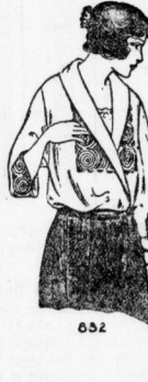
852. Kleiderbluse aus Seide oder leichtem Stoff mit abgesetztem Besatz und Schlitzen. Schlitze: 96 und 104 cm Oberweite. Abgabem. Nr. 2.50.