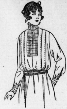
848. Gemtbluse mit farbigem Besatz und abgesetzten Falten. Schlitze in 104, 112 cm Oberweite.