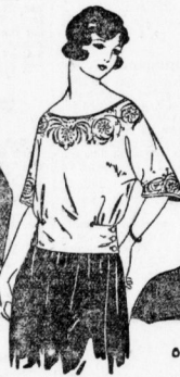
840. Gemtbluse mit Seidenfaser. Die Blusen können auch mit Vermet genäht werden. Schlitze in 96 u. 104 cm Oberweite. Abgabem. Nr. 6.00.