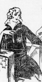
859. Seiden- oder Samtbluse in Schlitzenform. Schlitze sind in 96 u. 104 cm Oberweite erhältlich.