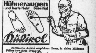
Hühneraugen können durch falsches Schuhwerk entstehen.

Hühneraugen sind ein häufiges Problem, das durch Reibung entsteht.