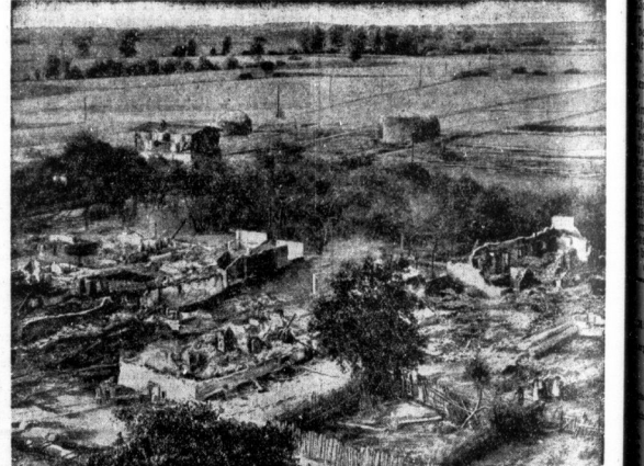
Das Bauerndorf Schwichtenberg wurde von einer schweren Brandkatastrophe heimgesucht, bei der 15 Gebäude mit insgesamt 48 Gebäuden ein Raub der Flammen wurden. Unser Bild zeigt einen Überblick der ausgebrannten Gehöfte, die, wie man vermutet, durch Brandstiftung vernichtet worden sind.