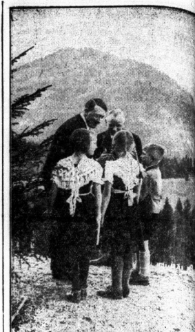
Der Freund der Kinder