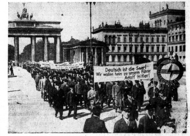
Die Saarländer bei ihrem Marsch durch das Brandenburger Tor

Drabung unseres Korrespondenten ex. Paris, 21. August. Das „Echo de Paris“ läßt sich aus Mailand melden, dass Mussolini tatsächlich eine mehrjährige Unterredung mit Erzherzog Otto gehabt habe, bevor dieser nach Standinaven gereist sei. Als Quelle dieser Nachricht bezeichnet das Blatt einen Herrschaftlichen Vertrauensmann. Es sei ganz sicher, dass Otto in Mailand gewesen sei. Mussolini habe aber nur in die Unterredung wegen des Besprechens ein- gewilligt, das der Prinz gleich nachher abrei- te. Der Duce habe sich gefreut, die Hoffnungen Ottos mit einem glatten Nein oder mit einem Ja zu demis- sieren. Erzherzog Otto soll dagegen die früher ge- äußerten Vorbehalte seiner Umgebung gegenüber dem Diktator nicht wiederholt und erklärt haben, daß