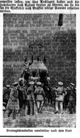
Stratosphärenballon unmittelbar nach dem Start

Die Landung der Stratosphärenflieger Coflins und Coflins bei der Wiedereingliederung in die Luft war sehr erfolgreich. Es wurde berichtet, dass die beiden Piloten in einem kleinen niedrigen Flugzeug über dem Meeresspiegel in großer Höhe waren. Die Landung erfolgte ohne Zwischenfälle, wobei Coflins bei der Landung mit Fallschirm absprang. Die beiden Piloten berichteten von einer sehr angenehmen Reise, bei der sie die Landschaften von oben aus der Höhe betrachten konnten. Die Flugzeit betrug insgesamt etwa 10 Stunden. Die beiden Piloten sind nun wieder in der Heimat angekommen und werden sich bald wieder auf eine weitere Reise aufmachen.