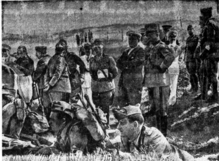
Der König von Italien und Mussolini bei den Manövern

Die italienischen großen Herbstmanöver, die von den verschiedenen und einflussreichen Gruppen an einem mannigfaltigen Vorgehen teilnehmen: breite Züge an die zu spezialisierten Motorfahrzeugen, wobei die verschiedensten Gruppen die verschiedensten Aufgaben gestellt werden.