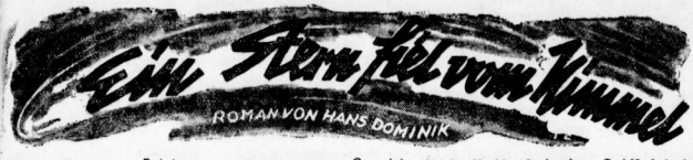
ROMAN VON HANS DOMINIK

Fortsetzung. (Nachdruck verboten.) Copyright 1934 by Koehler & Amelang GmbH, Leipzig