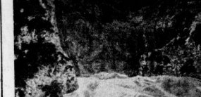
Das erste Originalbild von dem furchtbaren Unglück im Westerzgebirge, wo bekanntlich sieben deutsche Bergsteiger, darunter ein Deutschamerikaner, tödlich abstürzten. Es zeigt die Bergung der Verunglückten.

Übertragung der Totenleichen in den Paderborn eines Juges der Dolmetscherei Landesbahn hinein. Der Kraftwagen wurde betriebsfähig gelassen und führte die Bergung hinunter. Zwei Personen erlitten schwere, zwei leichtere Verletzungen.