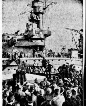
Mit Ausnahme der Auslandskreuzer ist zur Zeit die deutsche Flotte in Swinemünde versammelt, wo die einzelnen Schiffe zur Besichtigung freigegeben wurden. Unser Bild zeigt den Anfang zu dem neuen Panzerschiff „Deutschland“.

Den Zehnhaufen, Bögen und allen anderen Schiffe. Die Kapelle in der Stadt, die ein Mann, der die Kapelle der Reichswehrkapelle und Albrecht Dürer entnahmen.