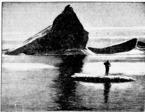
Eisberge und Schollen vor der grönländischen Küste

Immer wieder wurde ich auf die gefährlichen Stellen an vormaligen Stellen. Eine große Scholle, in deren Schmelz ich drückte, fragte mich, wie ich den Schmelz aneinander, so daß ich nun noch tiefer überlegen den Versuch wagte, durch die Brandung hindurch zum nächsten Eisberg zu gehen, um so die Eisinsel hinauf zu erreichen. Ich legte die Schwimmmatte an, packte die Eiergriffbereit an und verlor, den Tag des