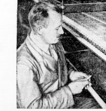
Rechts: Eine Frau kontrolliert die Maschine, die schließlich die Schachteln füllt.