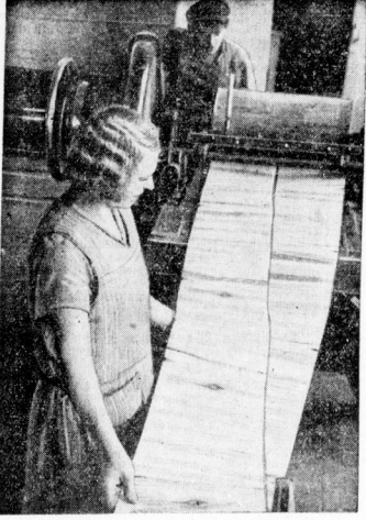
In der Schälmaschine werden die Hölzchen in etwa 3/4 Meter lange Bänder aufgeschnitten, die genau so sind wie das spätere Streichholz.

Eigenlich ist die Geschichte des Streich- oder Zündhölzchens noch gar nicht so alt. Kaum mehr als hundert Jahre kennt man die unheimlichen Hölzchen, mit