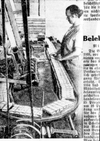
Rechts: Eine Frau kontrolliert die Maschine, die schließlich die Schachteln füllt.

gesamte Länge etwa 7 Meter. Zwei Millionen Streichhölzer laufen in einem Arbeitsgang durch diese Maschine, wobei die dickflüssige Zündmasse aufgetragen, gefolgt dabei dem Roß, in einigen Sekunden durch die ganze Maschine kommen am Ende fix und fertig getrocknet her. Zum Schluß läuft eine Maschine die fertigen Hölzchen in Schachteln, e dann ihren Weg in die Welt antreten.