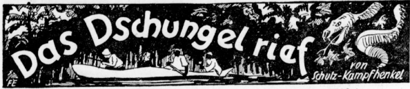
Zoologie-Student, Tierfänger, Urwaldjäger in liberianischer Wildnis

Fortsetzung. (Nachdruck verboten.) Copyright 1933 by Neufeld & Henius, Berlin