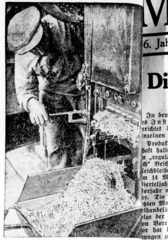
Aus den dünnen Holzstäben werden die Streichhölzchen geschnitten.

Rechts: Eine Frau kontrolliert die Maschine, die schließlich die Schachteln füllt.