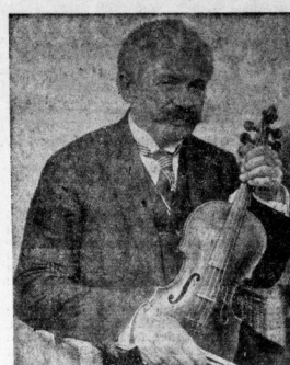
Der berühmte Geiger und Komponist, Prof. Henri Marteau, ist auf seiner Besitzung bei Lichtenberg i. Chr., 60 Jahre alt, gestorben.