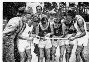
Der „Kriegsrat“ sagt... Bericht - das heißt, soweit sie nach Ziel und Kontrollpunkten schon wieder im „Heidepark“ eingetroffen waren...