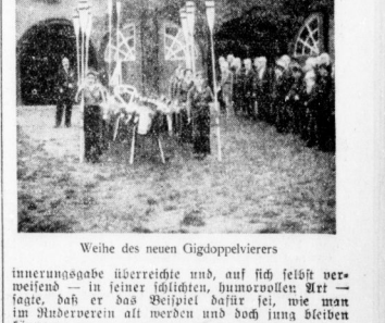
Weiche des neuen Giggdoppelrivers