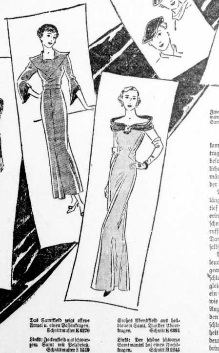
Zwei Samtkappen, wie man sie gerne zu Samtkleidern trägt, Schnitt V 2068