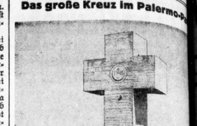
Das große Kreuz im Palermo