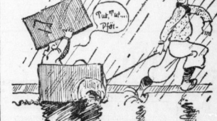
Es wurde eine recht wässrige Zerreißprobe...

Selbst angelegte Rennfahrer wären erbötigt, hätten sie dem folgenden Karren, dem Schlitzen und