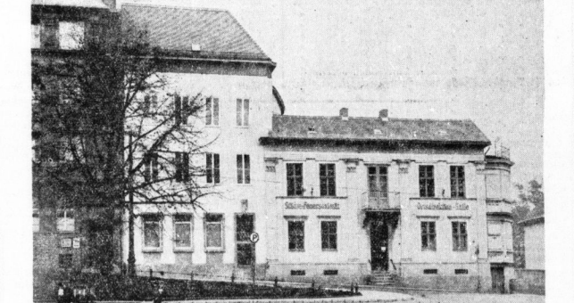
Der Erweiterungsbau der Städte-Feuersozietät der Provinz Sachsen

des Neubaus benutzt als Untergrund für den stärker gelagerten Mißbau darbot. Es war nicht leicht, der Neubau an den außerordentlich hohen Grundstücken des Nachbargrundstückes 20 anzupassen. Es wurde dadurch erreicht, daß man den Hauptteil des Neubaus in die Höhe eines Gebäudes des Nachbarhauses hinaufbaute. Im der Uebertragung von der mehr gelagerten Hausmaße des Mißbaues zu dem geteilten Charakter des Neubaus zu vermitteln, soll im Abgangswinkel in der Beziehung des Neubaus ein kleinerer Einfluß mit dem Wappen der Provinz Sachsen Anstellung finden. Ebenso soll der Schlußstein über dem Hauseingang durch Stützpfeiler gelagert werden. Die neue Eingangstür ist ein handwerkliches Meisterwerk in Metallarbeit. Die Tür gibt die Möglichkeit, den allein Umgang mit der freien Treue wegzulassen zu lassen. Die jetzige Türe im Mißbau soll auf den Abgang des Neubaus verlegt werden.