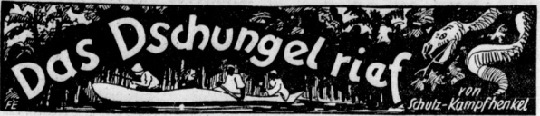
Das Dschungelrief von Schütz-Kampfenkel

Zoologie-Studen, Tierfänger, Urwaldjäger in liberianischer Wildnis