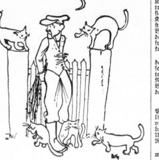
Der Baldriandieb in tausend Englein.

In Teufeln ist zwei Nachbarn ein Hund nachgefallen. In Wasenfeld im Obdars hat einem die Rüben nachgefallen und das war nicht ungeschicklich.