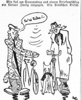
Und nun gab es drei Rüben...