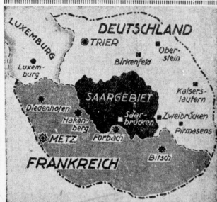
Übersichtskarte zu dem Erlaß des Saarbevollmächtigten Bürckel, wonach in einer Zone von 40 Kilometern rund um das Saargebiet das Tragen von Uniformen und die Veranstaltung von Appellen verboten wird. Während Deutschland so alles tut, um die freie und ungehinderte Volksabstimmung zu gewährleisten, stehen auf der französischen Seite lediglich ausgerüstete Divisionen. Auf französischer Seite bedeutet die 40-Kilometer-Zone eine häufiger waltender Festung mit Metz an der Spitze, während der nächste deutsche Soldat hinter dem entmilitarisierten Zone 120 Kilometer weit steht.

Wenn französische Vorkämmerer habe ich die Aufstellungen erhalten, daß die französische Regierung die Abgabe von Aufstellungen und Kundgebungen verboten haben.