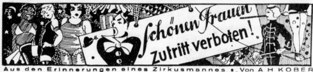
Aus den Erinnerungen eines Zirkusmännchens v. Von A. H. KOBER