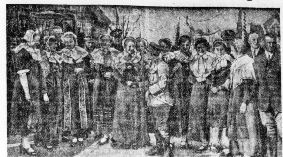
Der zur Zeit stattfindende Reichsbauerntag gibt dem ganzen Leben in Goslar sein Gepräge. Auf unserem Bild sehen wir Westfalenmädchen in ihrer schmucken Tracht auf einem Spaziergang durch die Stadt