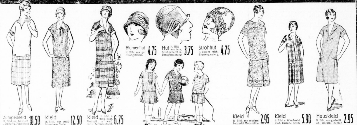
Jumperkleid 10.50, Kleid 12.50, Kleid 6.75, Blumenhut 4.75, Hut 3.75, Strohhut 4.75, Kleid 2.95, Kleid 5.90, Hauskleid 2.95

Mehrere Musterkollektionen div. Lederwaren... Große Eggen-Taschen... Brieftaschen... Zigaretten-Etui