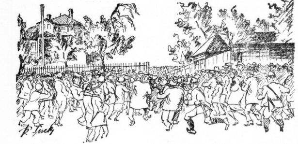
Der Massenandrang zum Sportplatz.