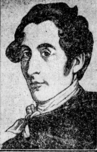
Jugendbild Karl Maria v. Webers.

Am 3. Juni fährt sich zum 100. Male der Todestag des 1826 zu London verstorbenen Komponisten Karl Maria von Weber. Seine Opern „Freischütz“, „Pezzo la“, „Cunrath“, „Oberon“ und die unvollendete „Die drei Pintos“ haben seinen Namen berühmt gemacht. (Vgl. das Feuilleton dieser Nummer.)