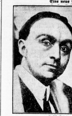
Portrait of a man, likely a doctor or official mentioned in the text.