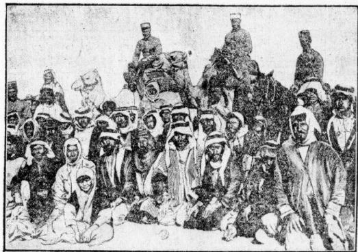
Eine Gruppe junger Truhen mit ihrer charakteristischen Haartracht. Die immer wieder auffommende frühe Unabhängigkeitsbewegung wird von den Franzosen mit aller Gewalt niedergedrückt.