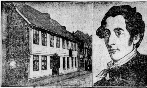
Geburtshaus Webers in Erfurt.

Sum 100. Todestag des Komponisten Karl Maria von Weber.