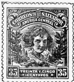
Der Substanz auf der Briefmarke. Die Republik El Salvador hat den Substanz in die Gesellschaft der Briefmarkensammler eingeführt.

Die erste Freistromturbine der Welt, das Werk eines Wiener, ist heute in der Donau bei Wien in Betrieb gesetzt worden. Das Geleite aus allen Herren Ländern suchte, ist dem Ingenieur G. Zuehlke, einem Enkel des großen Geologen Zuehlke, in einer langen Reihe von 100 000 Pferdestunden.