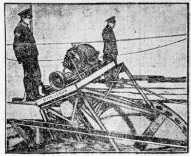
Die Turbine wird zur Befestigung aufgezogen.

Die erste Freistromturbine der Welt, das Werk eines Wiener, ist heute in der Donau bei Wien in Betrieb gesetzt worden. Das Geleite aus allen Herren Ländern suchte, ist dem Ingenieur G. Zuehlke, einem Enkel des großen Geologen Zuehlke, in einer langen Reihe von 100 000 Pferdestunden.