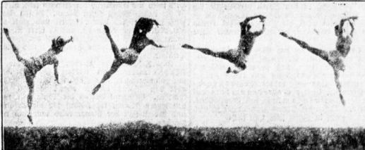
Der Wechselsprung. Eine Sprungübung in 4 Phasen aus der Schule Berkera, mit der Beifolge aufgenommen. Der bekannte Körpererzieher der U.S.A., Wege zu Kraft und Schönheit, hat bei seinen Forschungen auf dem Gebiet der weiblichen Körperkultur und Sport erreicht, erscheint jetzt in neuer Fassung auf der Welt. Besonders interessant für die neuen Zeitschriftenabnehmer von Sprung-, Tanz- und Laufbewegungen. (Der bekannte U.S.A. in neuer Fassung.)

schon im eigenen Hause gewissermaßen als Gast fänden, der nichts in die Wirtschaftsführung hineinbringen hat, Gerade nach dieser Richtung muß sich die Hausfrau selbst erheben um Ziele nehmen und mit dem einen einmal fünf gerade sein lassen. Ihre Ferien seien die Ruhe, den Sportbetrieben, dem Lesen eines guten Buches und anderem gewidmet. Ganz besonders aber beschäftigen sie sich mit Mann und Kindern, in einem geistlich-rechtlichen Sinn, denn dieser innere und innerliche Beziehung des Familienlebens wird ja durch den „erwerb“ und arbeitserfüllten Alltag immer mehr erdrückt. Der Urlaub, auch im eigenen Hause, ist seine Vorbereitung, denn läßt er sich wohl auch in die Tat umsetzen.