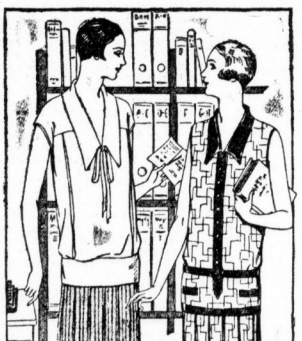
K 212. Kleider-Jumper zum Halbesand. Diese Kleider aus Wolle oder zum Sommer passenden Größe bis kleine sehr leicht unter der Größe mit auch ohne Jacke für den Sommer gut aus.