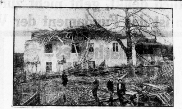
Die Würfelsturmstarköppe in der Schweiz.