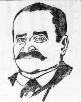
Zu den letzten Ereignissen in Spanien.