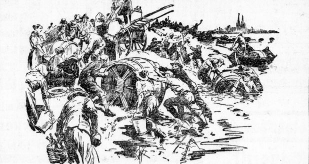
An der Köhler Gärtnerei fand sich ein gefährliches Strandgut...