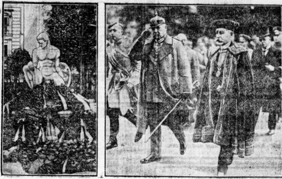
Das Denkmal nach der Enthüllung. Der Reichspräsident mit dem Rektor der Berliner Universität.