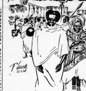
Der gefahrdrohliche Somali. - Krieg im Frieden. - Die Jehen als Schutzhelfer. - „Deutschland über alles.“