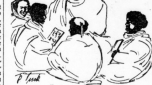
Die italienische Mission...