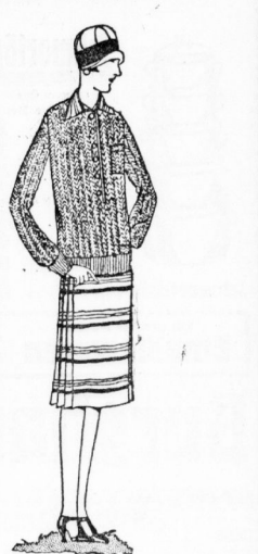
K 2191. Kleid mit hellem feinem Gestalt...