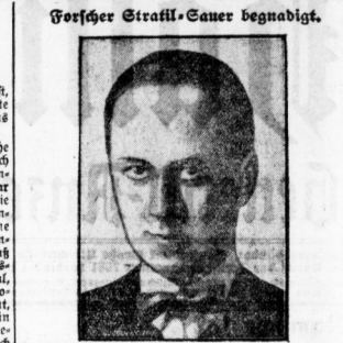
Der Reichstagler Strauß-Eauer begnügt. In Bayern wird auch in diesem Jahr ein amerikanischer Staatsbesuch stattfinden...