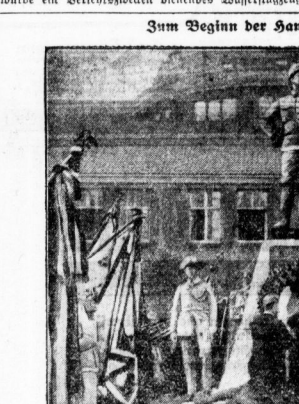
Planung der Expedition am Wismann-Festtag in Göttingen.