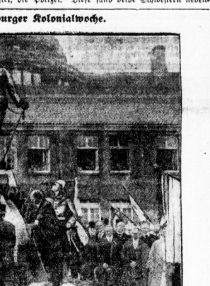
Planung der Expedition am Wismann-Festtag in Göttingen.