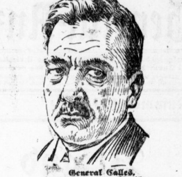
General Gales, Präsident von Mexiko, auf dem ein Attentat geplant war, aber rechtzeitig durch die Polizei vereitelt wurde.

Amst. 3. August. (Amst. 3. August.) Die Lage in Mexiko ist weiterhin gespannt. Die Verhandlungen zwischen den verschiedenen Parteien sind noch im Gange. Die Lage in Mexiko ist weiterhin gespannt.