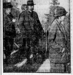
... (Caption for the portrait image.)

... (Continuation of the Berlin Brief article, discussing various local and national news items.)