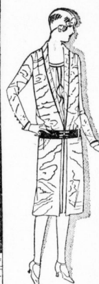
Schwarzes Moirékleid mit Vordereinander K 2274. Auf einem Saal ein weißer, rot eingereihter Streifen. Am Rücken bis zum Hüftende reibende Stoffe.

reibernen Jabot, das sowohl über die Kleideränder herausgehoben wie durch eine von Kleideranzug kleibrand laufende schmale, ebenfalls rot gezeichnete weiße Spange zusammengehalten werden kann. In den Rock ist als Fortsetzung des nach dem Gürtel verlaufenden Schulters ein weißer Streifen mit roter Mittellinie eingereiht, so daß eine reibungsartige Wirkung erzielt wird.