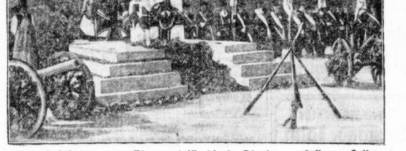
Grundsteinlegung zum Ehrenmal für die in Glandern gefallenen Helben der Marine in Kiel.