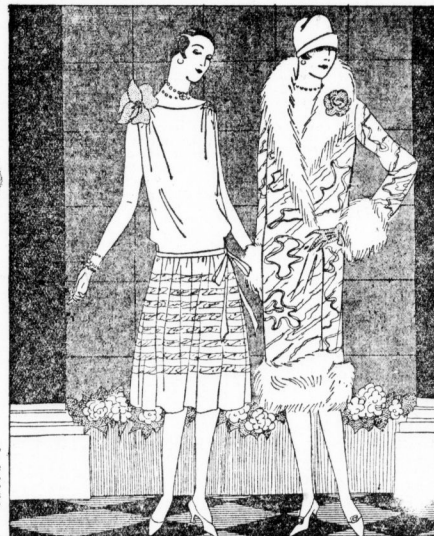
Einfaches Abendkleid mit Vordereinander K 2265. Rosa Georgette ist in halber Form gearbeitet und mit Vordereinander in der Farbe des Samtes besetzt, von der Schulter große Chiffonblüme.