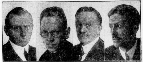
v. Rheinbaben (Dt. Volksp.), Dr. Raas (Ztr.), Graf Bernhoff (Dem.), Dr. Breitscheid (Soz.)