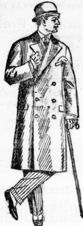
Dieser Paletot 45.- in schwarz u. marong, auf Sattella gearbeitet . . . kostet nur