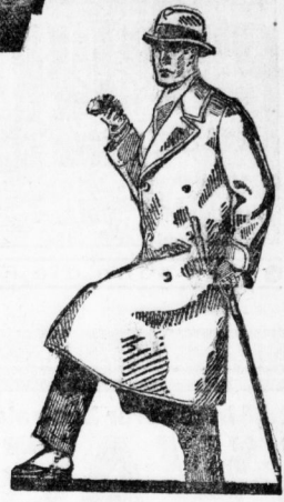
Dieser Uister 69.- moderne Machart, in Flausch und gemusterte Stoffe. . . kostet nur

Trotz dieser billigen Preise gewähren wir Ihnen bei einer ganz geringen Anzahlung für den Restbetrag einen mehrmonatlichen Kredit . Gekaufte Ware wird gegen Ausweis sofort ausgehändigt.