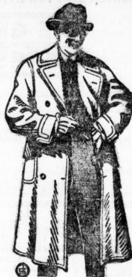
Dieser Uister 39.- mit eingewebht. Futter mit Gurt und Quetsch- falte . . . kostet nur