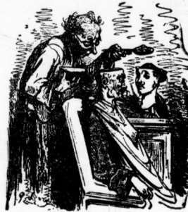
Der Sitz der Weisheit

Illustration aus einem Aufsatz über den unvergesslichen Grotte Dost