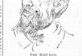
Das Problem der Farbentemmetographie gelöst. Die Wirtseffektivitätsgruppe in Florida, die dem, wie erinnerlich, mehr als 1000 Personen ins Leben gekommen sind.