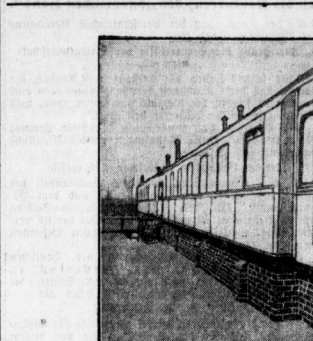
Eine D-Zug-Wohnanlage in Wittenberg.

Der Verkehr auf den Straßen... Die Stadt-Zeitung hat sich für den Verkehr auf den Straßen interessiert.