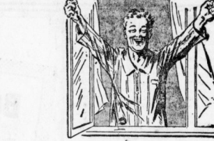
Immer so frisch - Kruschen-Salz erhält den gesunden Menschen frisch und elastisch.