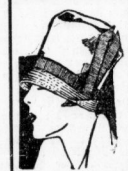
Flott. Übergangshut 3.85

Ein Lagerposten Bashenmützen aus Filz in verschiedenen Farben spottbillig! Stück 95