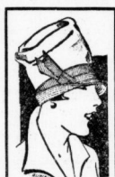
Fash. Übergangshut 2.85

Freitag, Sonnabend und Montag bieten wir im Rahmen des Verkaufes zu Einheits-Preisen hervorragend billigs an: