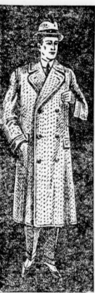
Ulster 59.- mit angew. Futter, Quetschlatte

Durch Selbstfabrikation unserer Gesellschaft wird wir in der Lage, trotz mehrmonatlichen Kredit zu diesen billigen Preisen zu verkaufen.