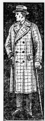
Ulster 89.- in den neuesten Stoffen, mod. Ueberkaros

Unser Geschäftsprinzip Bei einer ganz geringen Anzahlung gewähren wir Ihnen für den Restbetrag einen mehrmonatlichen Kredit.