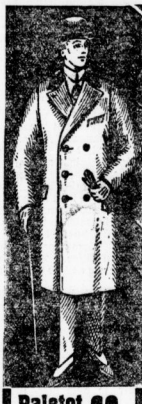
Paletot 69.- auf Sattella verarbeitet

Durch Selbstfabrikation unserer Gesellschaft wird wir in der Lage, trotz mehrmonatlichen Kredit zu diesen billigen Preisen zu verkaufen.