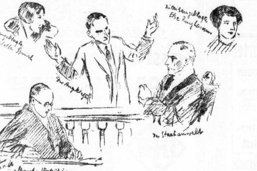
Subvelenänderung des Spruchs vor Gericht. Gegen aus dem Gefängnis.