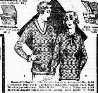
1) Dam.-Pullover H. Bild, weiches, Kammw. m. kräftiger, Bes. 9.75 2) Damen-Pullover, H. Bild, weiches, Kammw. l. hübsch, Farb. 8.75 Kindergrößen - Pullover - Serie u. Mäntel aus 1.95 Herren-Jugwesten, dunkelbl., zweif., halb, Qualit. St. 5.90