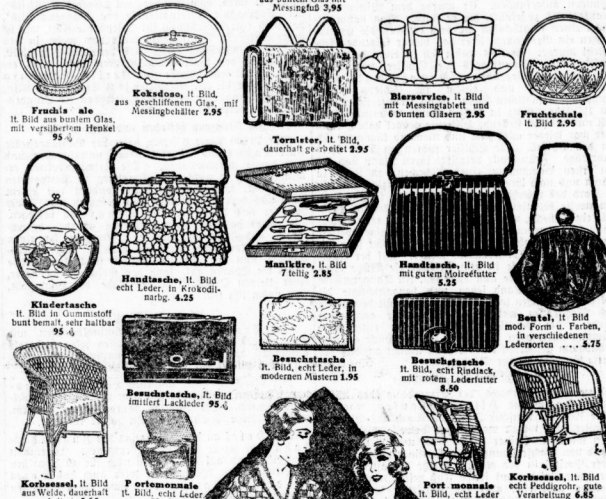
Fruchtale als H. Bild aus buntem Glas, 95 3 / 4