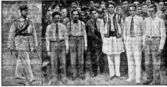
Die Führer der rumänischen 'Eisernen Garde'.

binett ist im übrigen unverändert geblieben. Von Titulescu ist immer noch keine Jähle vor, aber als Außenminister in das Kabinett einberufen. Oleschiu ist es nicht ausgeschlossen, daß Satarescu, der selbst noch sehr jung ist, auch zum Führer der Liberalen Partei ernannt werden wird. Die Ernennung Satarescus hat begrifflich keine erhebliche Veränderung hervorgerufen. Er entstammt einer alten Ministerfamilie und ist ein Bruder des Stefan Satarescu, der kürzlich in Rumänien den militärischen Beruf unterzogen hat. Eine rumänische Nationalsozialistische Partei ist noch nicht in Rumänien gegründet worden.