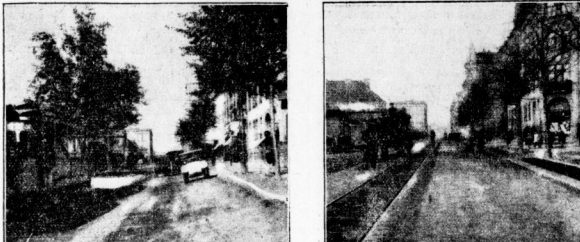
Der alte Böllberger Weg: steile Böschung, halbe Halterbahn, Straßenbahn einseitig.