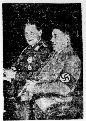
bei einer Brünner Film-Übernahme am Geburts-