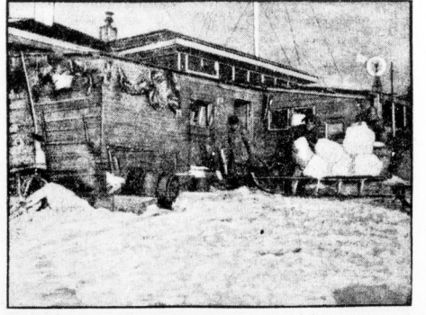
Das Internationales Polarjahr der Expedition in "Silke" Wadd auf Franz-Josefs-Land. Es wird gerade ein Bad vorbereitet und das dazu notwendige Wasser in großen Eimeren über den Schnee transportiert.