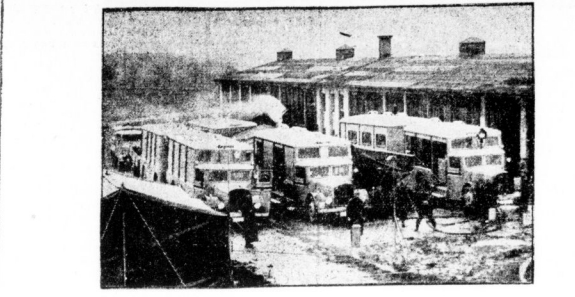
Der erste Hilfszug der NS-Volkswohlfahrt, der bei allen Katastrophen wie Naturkatastrophen, Eisenbahnzusammenstößen, Großbränden, Grubenunfällen usw. eingesetzt werden kann. Der Hilfszug besteht aus einer Reihe von Lastwagen und enthält eine Verpflegungsgesellschaft mit Küche, lerner eine Sanitätsstation, die einen Operationsraum und ein Lazarett umfaßt, und schließlich die Hilfspersonal, die bei Katastrophen benötigt werden. Er ist auf den Namen Bayern getauft worden.