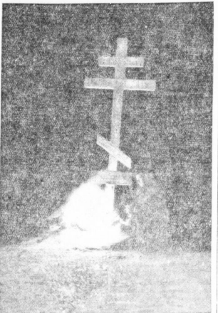
Zwei Wärfel, eines Mitglied der Seemanns-Erpedition ...