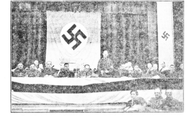
Kreisleiter Ollsch eröffnet den Parteitag im Saale des Gesellschaftshauses Leuna.

Schon in den frühen Morgenstunden des Sonntags, dem die leuchtend klare Sonne und der blaue