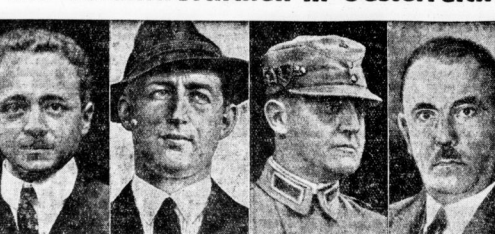
Von links nach rechts: Bundeskanzler Dollfuß, Heimwehrführer Starbemberg, Sicherheitsminister Fey und der frühere Vizekanzler Schmitz, der jetzt zum Bundeskommisssar für Wien ernannt wurde