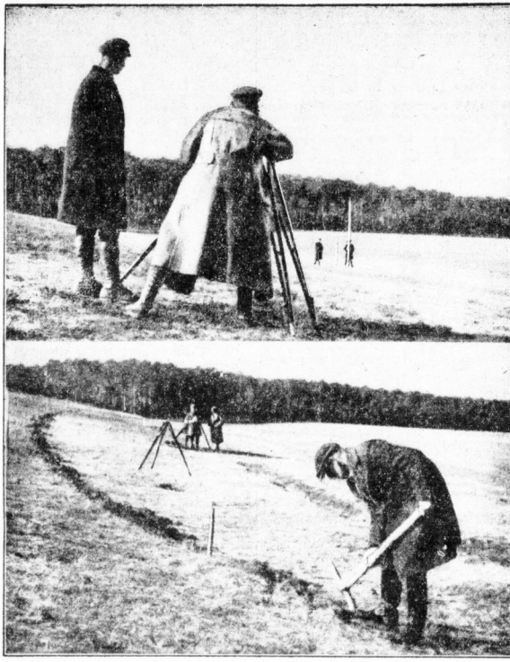
Oberes Bild: Landmesser am Theodolit. — Unteres Bild: Die Konturen werden festgelegt