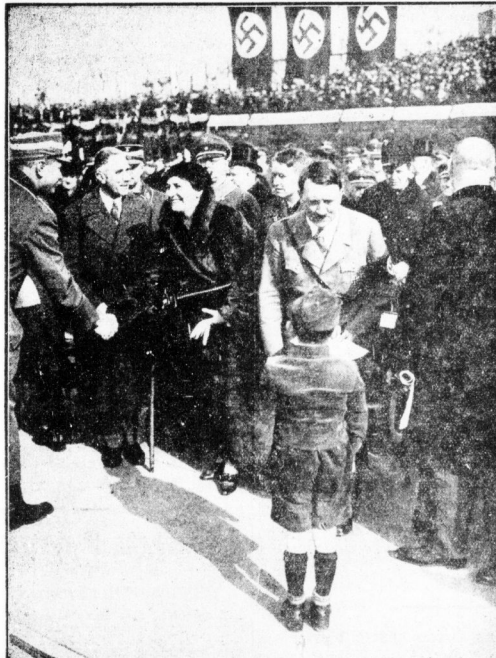
Der Führer, der zur Grundsteinlegung für das Richard-Wagner-Denkmal nach Leipzig gekommen war, begrüßt einen kleinen begeisterten Jungen. Dahinter sieht man Frau Winfried Wagner und Vizekanzler von Pappi, rechts hinter Frau Wagner ihren Sohn.