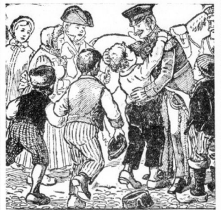
enfanke kurze Zeit darauf für sich und seine Erben dem französischen Thron...