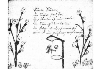
Rörber, Vieber Unkel Gai, ich werde Dir nun oters mal schreiben...